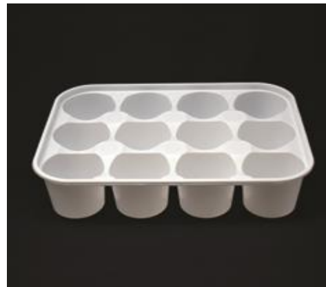
Possibilité d'étiquetage manuel

Contact alimentaire ► tous types d'aliments (en lien avec le certificat d'alimentarité)