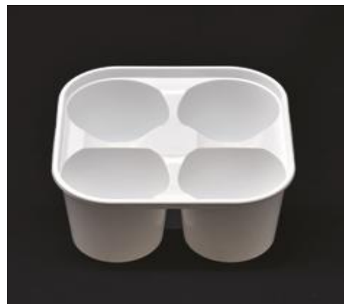
Possibilité d'étiquetage manuel

Contact alimentaire ► tous types d'aliments (en lien avec le certificat d'alimentarité)