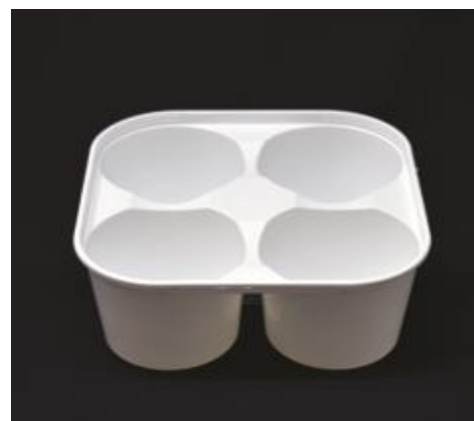
Possibilité d'étiquetage manuel

Contact alimentaire ► tous types d'aliments (en lien avec le certificat d'alimentarité)