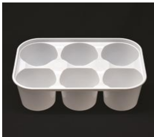
Possibilité d'étiquetage manuel

Contact alimentaire ► tous types d'aliments (en lien avec le certificat d'alimentarité)